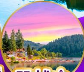
ทิกเกเซ่ ปาดำ