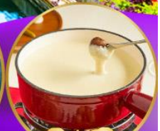
ฟองดูชีส