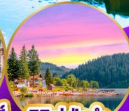
ทิกเกิเซ่ ปาดำ