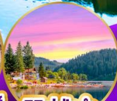
ทิกิเซ่ ปาด้า