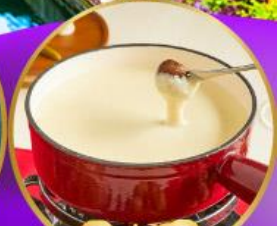
ฟองดูซีส