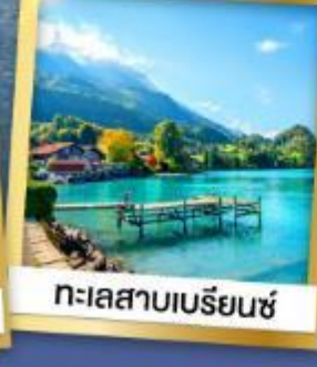
ทะเลสาบเบร์ชเทินซ์