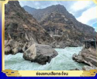
ช่องแคบเลียงโจน