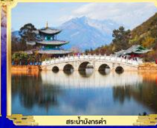
สะพานมังกรดำ