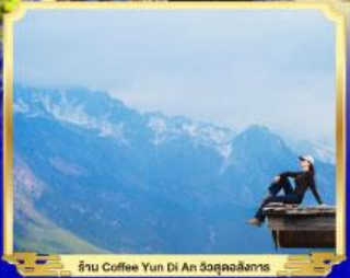
ร้าน Coffee Yun Di An 3จุดเช็คอิน