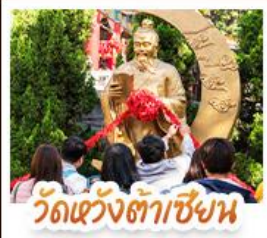
วัดเซ่งต้าซิงหน