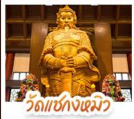
วัดเชกงเมิว