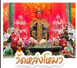
วัดเล่งโงเมิว

นั่งรถรางพืดแตรมสู่ TOP OF PEAK • ซ้อปั้งจู่จิมงกิก และ CITYGATE OUTLAETS • นั่งกระซ่านองปิง สักการะพระใหญ่เทียนถาน • จอพรเจ้าแม่หล่งโหมว แมอง 5 มังกร ใ้ประสบความสำเร็จในทุกๆ ค้าน