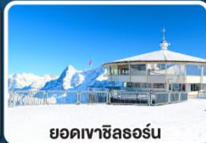
ยอดเขาซิลรอร์น