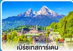
เบิร์ชเทสการ์ดเดน