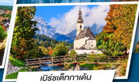
เบิร์ชเต็กกาเดิน