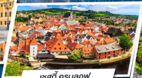
เซสกี ครุมลอฟ