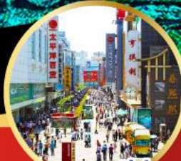
ถนนชุนชี่ลู่