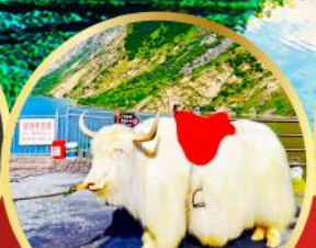
ทะเลสาบเต๋ยซี่