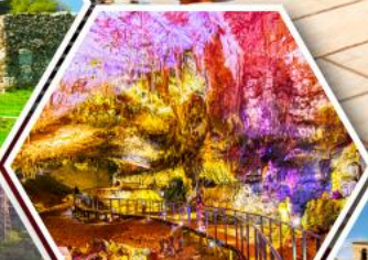
ถ้ำไฟรมีริอุส