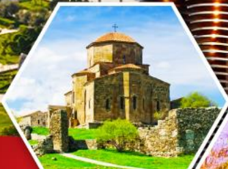
วิหารจอร์