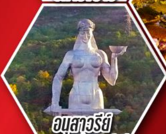
อนุสาวรีย์