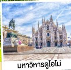
มหาวิหารดูโอโม