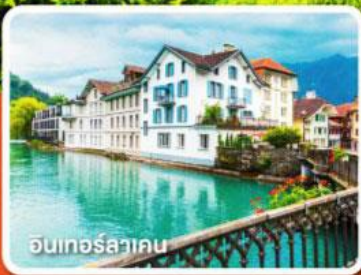
อินเทอร์ลาเคน