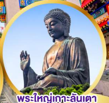
พระใหญ่เกาะลันเตา