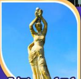
จูโหล่ฟิชเซอร์เกิร์ล