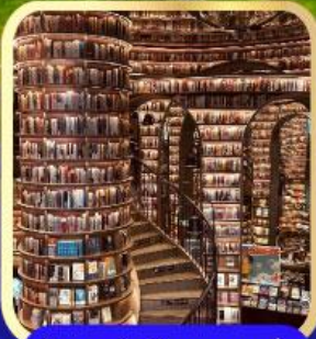
ร้านหนังสือจวงซูเก้อ