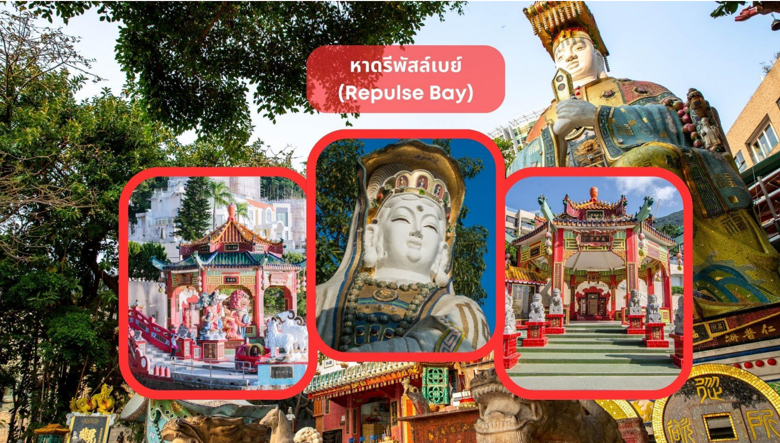
หาดรีพัลส์เบย์ (Repulse Bay)

รับประทานอาหารเช้า ณ ภัตตาคาร บริการท่านด้วยเมนูติ่มซำฮ่องกง (มื้อที่ 3)