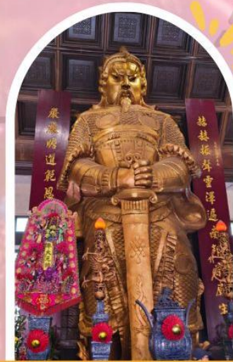
วัดแซกกง ขอพรโชคลาก การเงิน และธุรกิจ