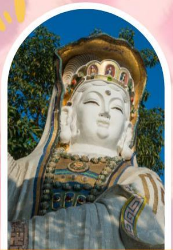
ริพลัสเบย์ รับพลังงานดี เสริมพลังดวงจัญ