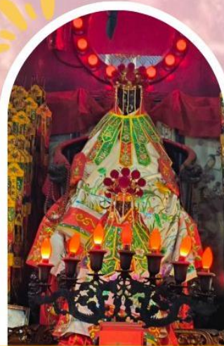
วัดเจ้าแม่กวนอิมอ่องฮำ ขอพรเรื่องเงิน ทรัพย์สิน และความมั่งคั่ง