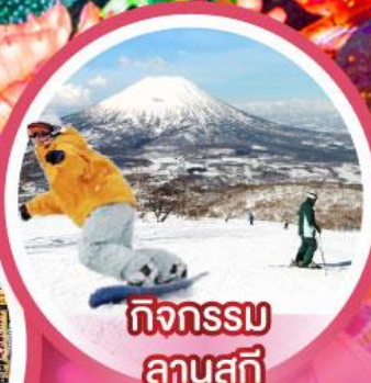
กิจกรรม ลานสกี