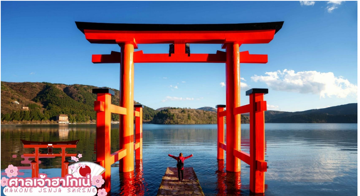
ศาลเจ้าฮาโกเน่ HAKONE JINJA SHRINE

ศาลเจ้าฮาโกเน่ (Hakone Jinja Shrine) ตั้งอยู่ใกล้กับทะเลสาบอาชิ (Lake Ashi) ซึ่งเป็นที่เที่ยงที่ได้รับความนิยมอย่างมากในแถบฮาโกเน่ ศาลเจ้าแห่งนี้มีความเชื่อในเรื่องช่วยให้เดินทางปลอดภัย ช่วยให้อุดพ้นจากเคราะห์ภัย โดยในแต่ละปีมีนักท่องเที่ยวเข้ามาแวะเวียนมาที่นี่มากกว่า 20 ล้านคน