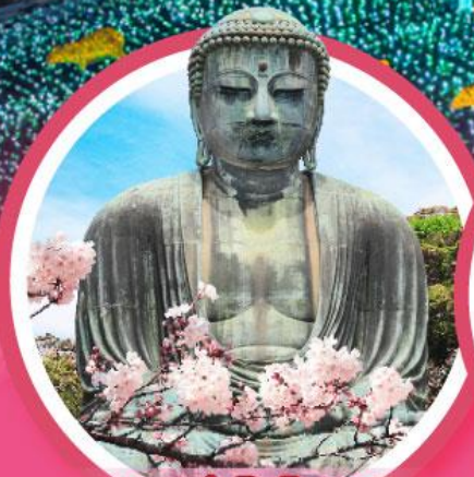
หลวงพ่อดโตโดบุตสึ