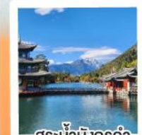
เมืองโบราณแชงกรี่ล่า