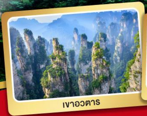
เวาอวตาร

เวาเจ็ดดาว อุทยานแห่งชาติจางเจียเจีย 5วัน 4คืน