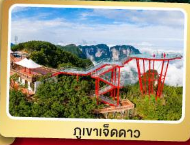
ภูเวาเจ็ดดาว