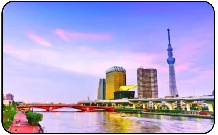
แม่น้ำสุมิตะ

สักการะ วัดมัตสึจิยามะโชเต็น หรือ “วัดหัวไชเท้า” ซึ่งเป็นวัดเก่าแก่ในย่านอาซากุสะ เป็นวัดเก่าแก่ในย่านอาซากุสะ กรุงโตเกียว ตั้งอยู่บนเนินเขาเล็ก ๆ ริมแม่น้ำสุมิตะ จุดเด่นคือเป็นวัดที่ขึ้นชื่อเรื่อง “ขอพรด้านการเงิน” โชคลาภ และความสำเร็จในธุรกิจ ส่วนไฮไลต์สำคัญของวัดนี้คือ ไคคอน หรือหัวไชเท้า สัญลักษณ์ศักดิ์สิทธิ์ คนที่นี้เชื่อว่าไคคอนช่วย “ชำระล้างสิ่งไม่ดี” และนำโชคลาภเข้ามา นักท่องเที่ยวมักนำไคคอนไปถวายเพื่อขอพร