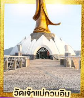
วัดเจ้าแม่กวนอิม