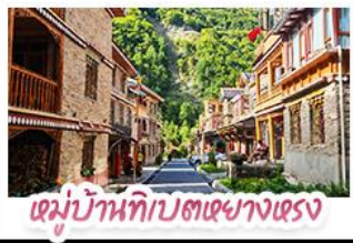
หมู่บ้านทิเบตผางแดง

ตะลุยเจียงคู หิมะ-ตำกูปิงชาน ชมเช็กอินแพนด้ายักษ์ พักใจที่หยดน้ำดาสีฟ้า! แวะชิลเมืองโบราณลั่วไต้ สัมผัสสมมติเสน่ห์ หมู่บ้านทิเบตทางทรงฮาตือ สัมผัสความหนาวเย็นที่ อุกยาบสวรรค์ธารน้ำแข็งตำกูปิงชาน แหล่งรวมวิวหลักล้าน ตื่นตาไปกับแสงสียามค่ำคืน หยดน้ำดาสีฟ้า ณ สะพานหนานเฉียว เมืองดูเจียงเยี่ยน ก่อนปิดท้ายด้วยการช้อปปิ้งจุใจ ถนนชุนซู่-ไถ่กุหลี่ และอะภาพทัก แพนด้าเซลฟี่ สุดคิวท์