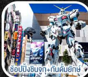
ช้อปปิ้งชินจูกุ+กินคิมยักซ์