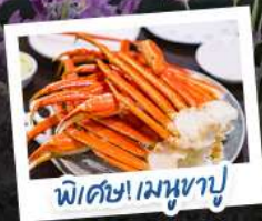
พิศมเมหนุซาปู