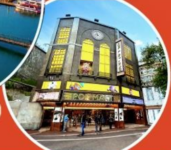
ร้าน POP MART ใหญ่ที่สุดไต้หวัน