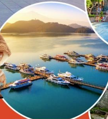
ทะเลสาบสุริยอันจินตรา