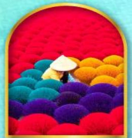
หมู่บ้านรูปหลากสี