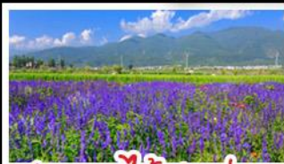
สวนดอกไม้ฮาวอวูมี๋ฉ่าง