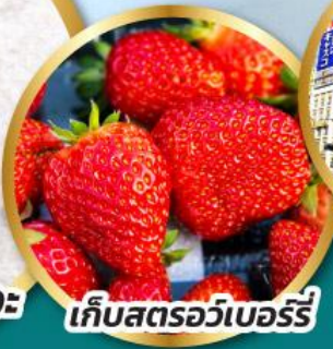
เก็บสตรอว์เบอร์รี่