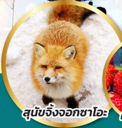
สุนัขจิ้งจอกซาโอะ