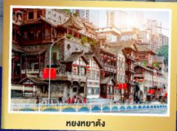
หยงหยาดัง