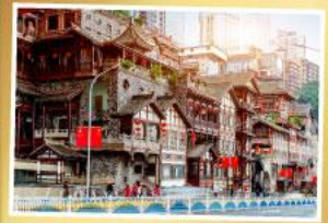
หยงหยาดัง