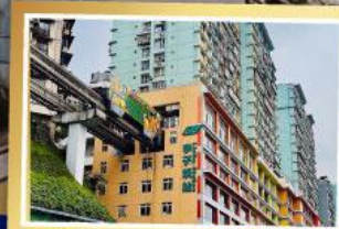
รถไฟฟ้า: ลูตัก