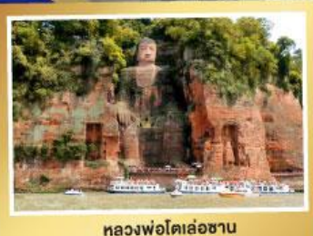
หลวงพ่โตเล่อซาน