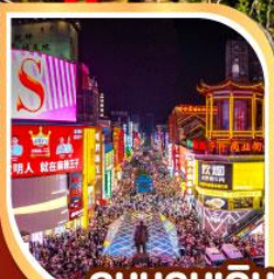
ถนนคนเดิน หวงซิงลู่