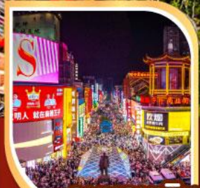
ถนนคนเดิน หวงซิงลู่