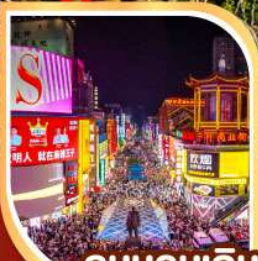
ถนนคนเดิน หวงซิงลู่