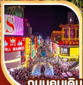
ถนนคนเดิน หวงซิงลู่