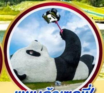
แพนต้าเซลฟี