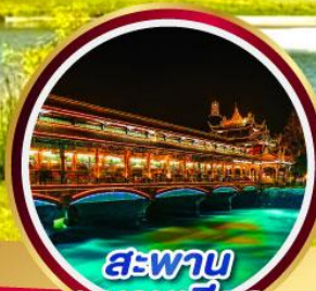
สะพาน หนานเจียว