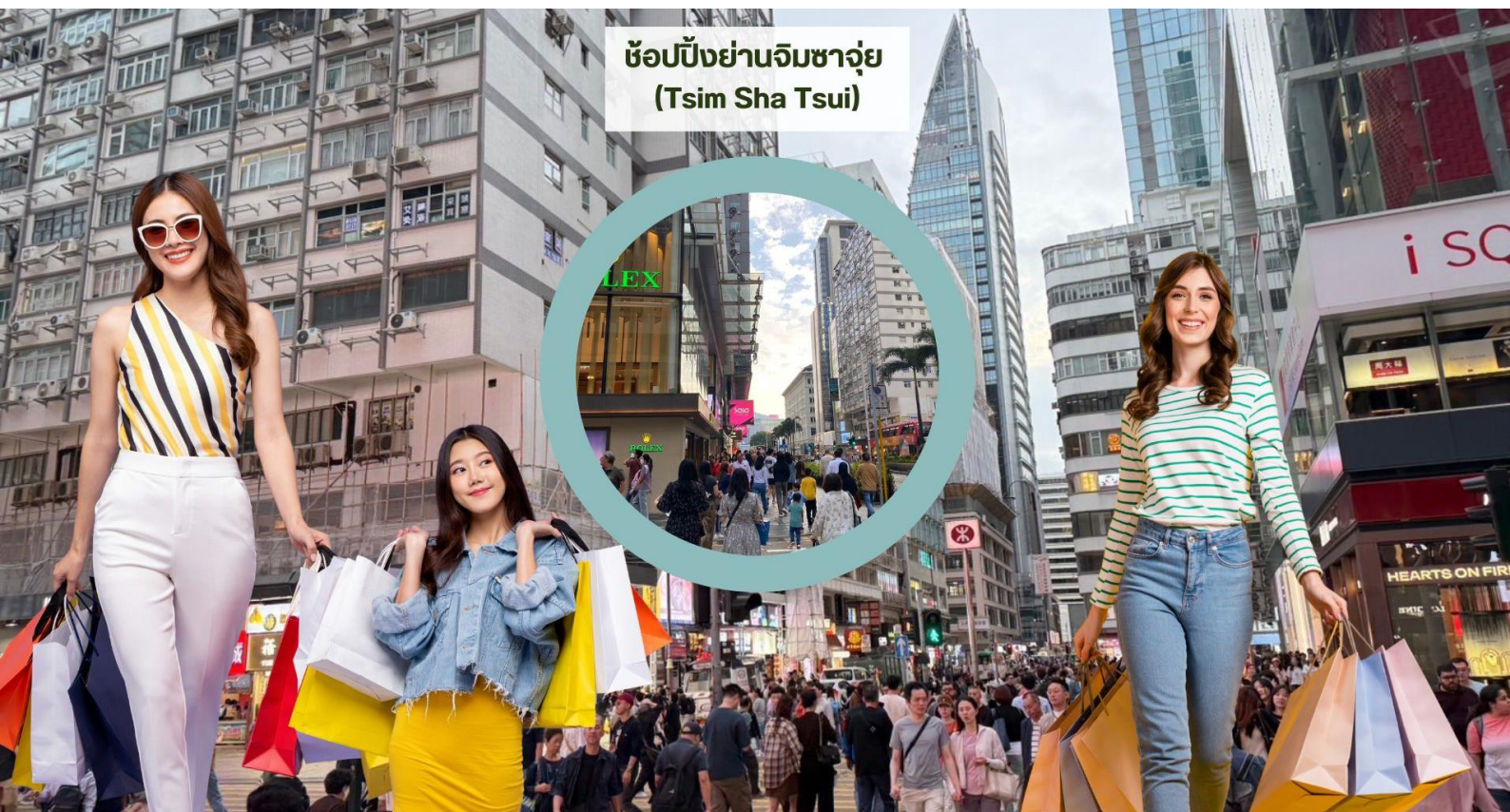
ช้อปปิ้งย่านจิมซาจู้ (Tsim Sha Tsui)

จากนั้นอิสระให้ท่านเต็มอิ่มกับการ ช้อปปิ้งย่านจิมซาจู้ (Tsim Sha Tsui) มักจะตั้งต้นกันที่สถานีจิมซาจู้ มีร้านขายของทั้งเครื่องหนัง, เครื่องกีฬา, เครื่องใช้ไฟฟ้า, กล้องถ่ายรูป ฯลฯ และสินค้าแบรนด์ที่เป็นของพื้นเมืองฮองกงอยู่ด้วยและตามชอคดีกอันซัพซ็อนมากมายมี Shopping Complex ขนาดใหญ่ชื่อ Ocean Terminal ซึ่งประกอบไปด้วยห้างสรรพสินค้าเรียงรายกันอยู่ และมีทางเชื่อมติดต่อกันสามารถเดินทะลุถึงกันได้ ให้แบรนด์ดังมากมายให้ท่านได้เลือกซื้อ ไม่ว่าจะเป็น Coach, Longchamp, Louis Vuitton, Hemes, Prada, Giordano, Bossini และอีกมากมาย