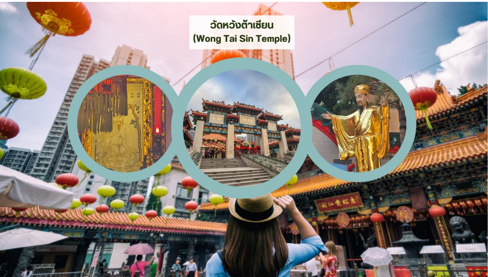
วัดหวังต้าเซียน (Wong Tai Sin Temple)

เช้า รับประทานอาหารเช้า ณ ภัตตาคาร บริการท่านด้วยเมนูติ่มซำฮ่องกง (มื้อที่ 3)