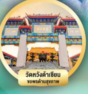
วัดหวังต้าเซียน ขอพรด้านสุขภาพ

เดินทาง 31 ต.ค.-02 พ.ย. 68 12-14, 26-28 ธ.ค. 68 16-18 ม.ค. 69 30 ม.ค.-01 ก.พ. 69 06-08 ก.พ. 69 06-08, 20-22 มี.ค. 69 27-29 มี.ค. 69