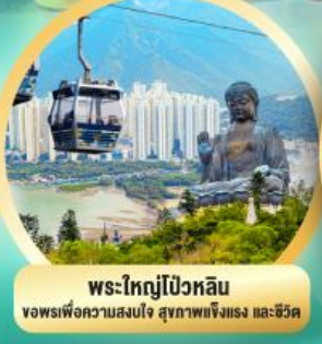
พระใหญ่ไป้วหลิน ขอพรเพื่อความสงบใจ สุขภาพแข็งแรง และชีวิต