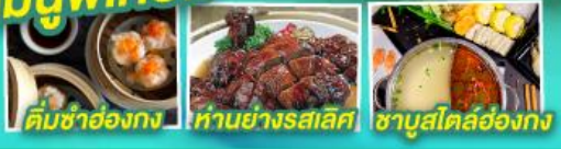
ติ่มซำฮ่องกง, ห่านย่างรสเลิศ, ซาซุสไคล์ฮ่องกง