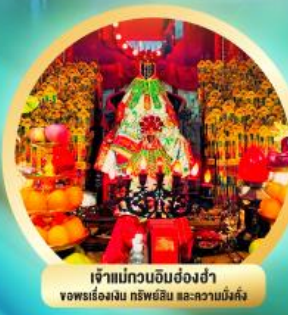
เจ้าแม่กวนอิมฮ่องงำ ขอพรเรื่องเงิน ทรัพย์สิน และความบันเทิง