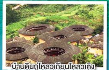
บ้านดินกู่ไหลวเทียนไหลวเค็ง