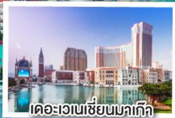
เดอะเวเนเซียนมาเก๊า