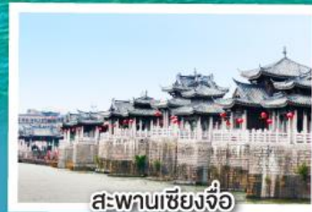
สะพานเซียงจื่อ