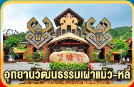
อุทยานวัฒนธรรมเฉาแม้ง-หลี่