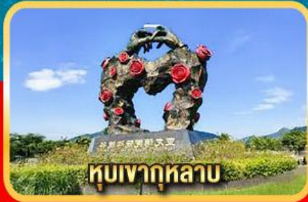
หุบเขากุหลาบ