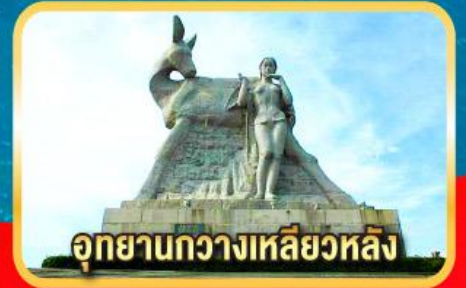
อุทยานกว้างเหลียวหลิง

เมนูพิเศษ! ลิ้มรส ไก่โหลล่า, เซตซีฟู้ดกึ่งมังกร, ขันโตกข้าวเหนียวห้าสี, อาหารเจ ณ สวนพุทธธรรมหนานชาน