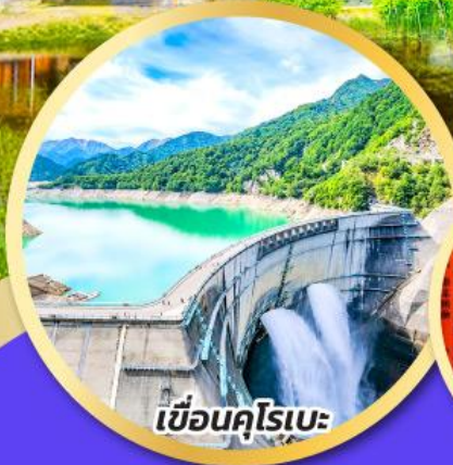
เชื้อนคุโรเบะ