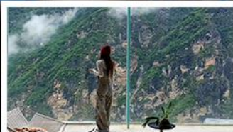
MOYE CLIFF COFFEE