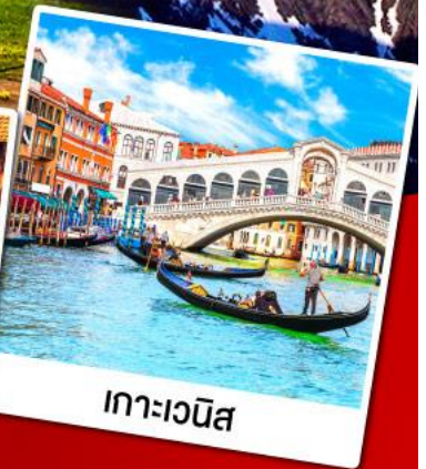
เกาะเวนิส