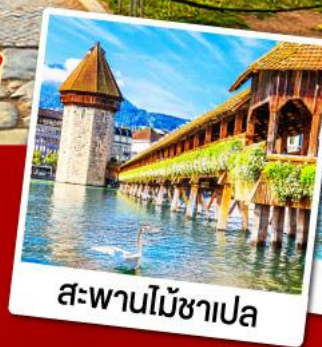
สะพานไม้ชาเปล

31 พ.ค.-08 มิ.ย. 68 14-22 มิ.ย. 68 10-18 ก.ค. 68