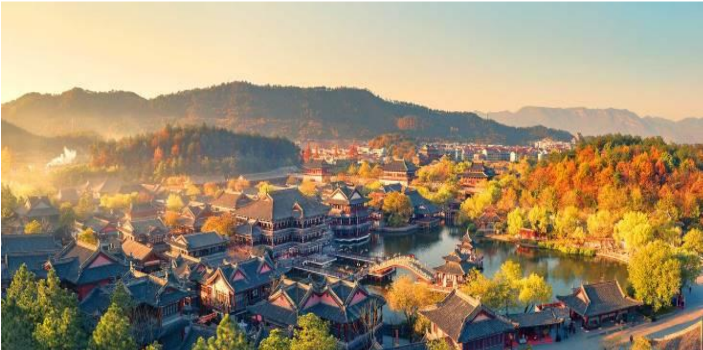
GO1HGH-CA002 หังโจว เติ้งเตี้ยน หวงหลิง หุบเขาเทวดาฉีเจี้ยนกู่ 6วัน 4คืน โดยสายการบิน AIR CHINA (CA)

04.20 น. ออกเดินทางสู่ นครหังโจว โดยเที่ยวบินที่ CA716 08.55 น. เดินทางถึง ท่าอากาศยานนานาชาติหังโจวเสี่ยวซาน เมืองหังโจว หลังผ่านพิธีการตรวจคนเข้าเมืองแล้ว เช้า รับประทานอาหารเช้า Set Box แซมเบอร์เกอร์ (มื้อที่ 1) นำท่านเดินทางสู่ เหิงเตี้ยน เมืองที่ได้ชื่อว่าเป็นเมืองแห่งภาพยนตร์ระดับโลก สร้างขึ้นในปี ค.ศ. 1996 ปัจจุบันได้กลายเป็นฐานการถ่ายทำภาพยนตร์ที่มีขนาดใหญ่ที่สุดในโลก จนได้รับการยกย่องว่าเป็น “ฮอลลีวูด แดนตะวันออก” กลางวัน รับประทานอาหารกลางวัน ณ ภัตตาคาร (มื้อที่ 2) จากนั้นนำท่านชม โรงถ่ายภาพยนตร์ชื่อดัง HENGDIAN WORLD STUDIOS โรงถ่ายภาพยนตร์และละครโทรทัศน์จีนที่ใหญ่ที่สุดในโลก สร้างขึ้นในปี ค.ศ. 1996 มีพื้นที่กว่า 3,300 เฮกเตอร์ หรือประมาณ 13,000 ไร่ ที่จำลองเอาบ้านเมืองในยุคสมัยทางประวัติศาสตร์ต่างๆ ทั้งพระราชวังหมู่บ้านตามยุคสมัยมารวมไว้ในสถานที่เดียว ประกอบด้วยฉากจำลองต่างๆ กว่า 700 ฉาก และยังมีฉากด้วยสเกลเทียบเท่าของจริงอีกด้วย ในปัจจุบันมีผู้เข้าชมสตูดิโอแห่งนี้กว่า 10 ล้านคนต่อปี เป็นแหล่งท่องเที่ยวระดับ 5A ของจีนที่ได้รับความนิยมอย่างมากของชาวจีนและชาวต่างชาติที่ต้องลงไปเยือนสักครั้ง นำท่านชม พระราชวังกู้กงหมิงซิงจำลอง ในโรงถ่ายภาพยนตร์เหิงเตี้ยน ภายในจำลองพระราชวังกู้กง ในอัตราส่วน 1:1 เพื่อการถ่ายทำในส่วนพระราชวังโบราณ และนำท่านชม พระราชวังจำลองจิ้นซีฮ้องเต๋