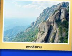
เขาหลงซาน