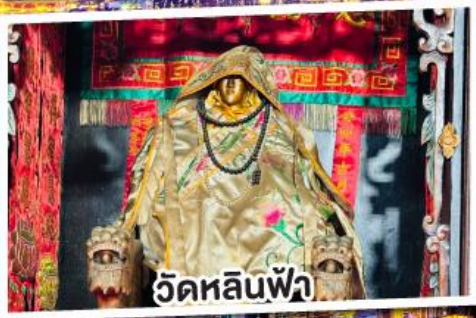
วัดหลินพัล