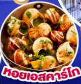
หอยเอสคาร์โก