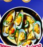
หอยนางรมไวน์ขาว