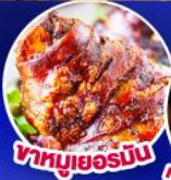
หมูเยอรมัน