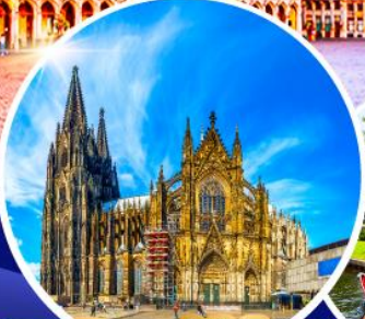
มหาวิหารแห่งโคโลญ หมู่บ้านทึร์ซัน