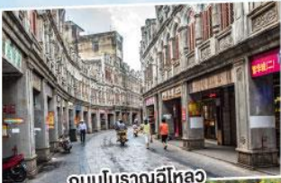
ถนนโบราณฉีหลาว