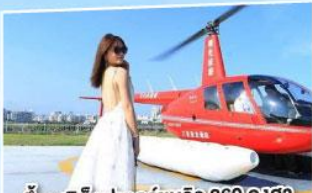
ขึ้นเฮลิคอปเตอร์ชมวิว 360 องศา