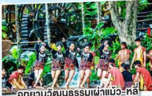
อุทยานวัฒนธรรมเผ่าแม้ว-หลี่