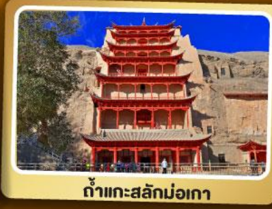
กำแพงสะลักม่อเกา