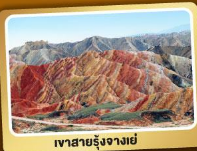
เวาสายรุ้งจางเย่