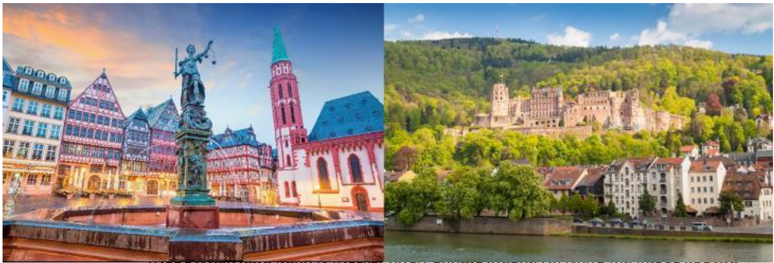
เป็นที่ตั้งของมหาวิทยาลัยไฮเดลเบิร์ก ซึ่งเป็นมหาวิทยาลัยแห่งแรกของเยอรมัน ด้วยความสวยงาม