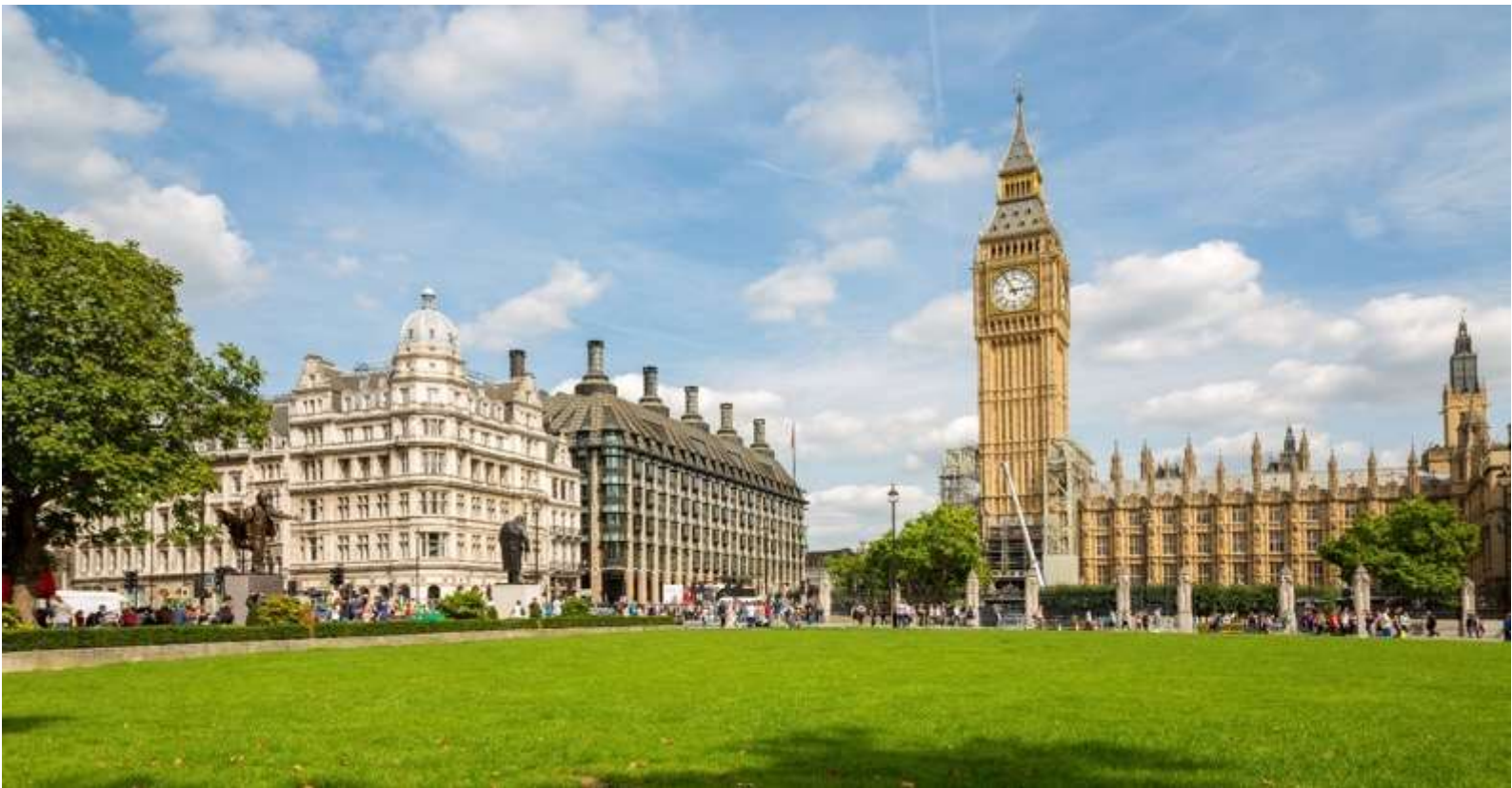
ลอนดอนในการถ่ายทอดเสียงการตีระฆังไปทั่วโลก

นำท่านเดินทางสู่ จัตุรัสทราฟัลการ์ (Trafalgar Square) จตุรัสกลางเมืองที่รายล้อมไปด้วยอาคารราชการสำคัญของเมืองลอนดอน นำท่าน ถ่ายรูปเป็นที่ระลึก กับ จัตุรัสรัฐสภา (Parliament Square) และ พระราชวังเวสต์มินสเตอร์ (Westminster Palace) หรือ ตึกรัฐสภาเวสต์มินสเตอร์ (Houses of Parliament) เป็นสถานที่ที่สภาสองสภาของรัฐสภาแห่งสหราชอาณาจักร (สภาขุนนาง และสภาสามัญชน) ใช้ประชุม สิ่งก่อสร้างส่วนใหญ่สร้างในคริสต์ศตวรรษที่ 19 แต่ก็ยังมีส่วนก่อสร้างเดิมเหลืออยู่บ้างเล็กน้อยรวมทั้งห้องพระโรงที่ในปัจจุบันใช้ในงานสำคัญๆ ได้รับการขึ้นทะเบียนให้เป็นมรดกโลกโดยองค์การสหประชาชาติ หรือ ยูเนสโก เมื่อปี ค.ศ. 1987 นำท่านถ่ายภาพคู่กับ หอนาฬิกาบิ๊กเบน (Big Ben) ของกรุงลอนดอนประเทศอังกฤษ ตั้งอยู่บนหอสูง 180 ฟุต หน้าปัดกว้าง 23 ฟุต ตัวเลขบอกเวลายาว 24 นิ้ว กระจกตีหนักถึง 14 ตัน สร้างขึ้นโดย เอ็ดมันด์ เมคเกตต์ เดนิสัน เป็นนาฬิกาที่ใหญ่ที่สุดในโลก เป็นศูนย์ควบคุมเวลามาตรฐานของโลกกรีนวิช ซึ่งใช้ในการบอกเวลาของโลกโดยผ่านทางวิทยุ BBC