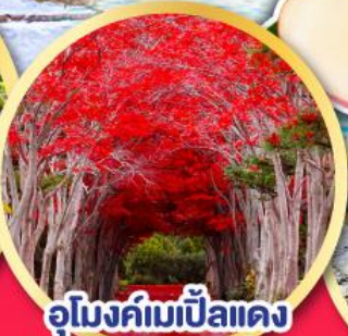
อุโมงค์ไม้แป้นแดง ณ สวนลับฮิราโอกะ