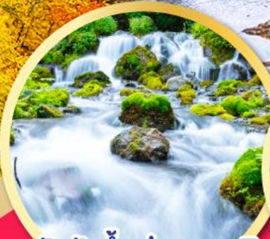
สัมผัสน้ำแร่ธรรมชาติ ณ สวนฟุทิดาชิ