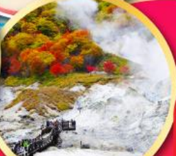
หุบเขาบนรถจิโกกุคานิ