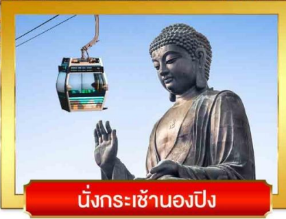
นั่งกระเช้ามองปิง