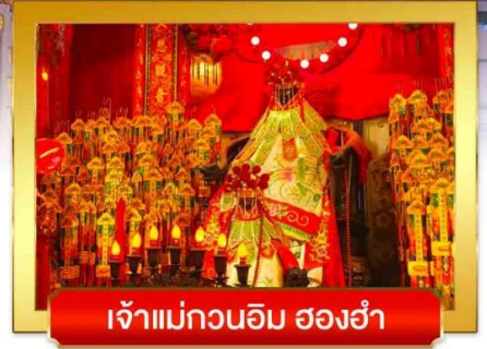
เจ้าแม่กวนอิม สองห้า