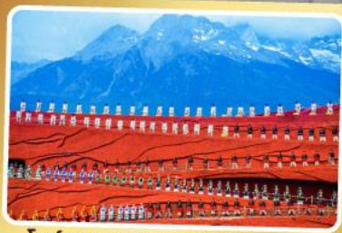
โซ่ว IMPRESSION LIJIANG