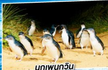
นกเพนกวิน