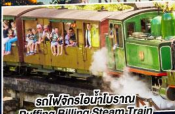
รถไฟจักรไอน้ำโบราณ Puffing Billing Steam Train