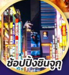
ช้อปปิ้งชินจูกุ