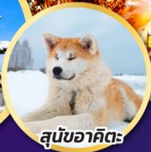
สุนัขอาคิตะ