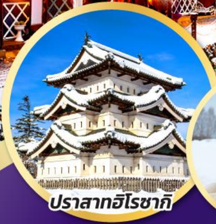
ปราสาทอิโรซากิ