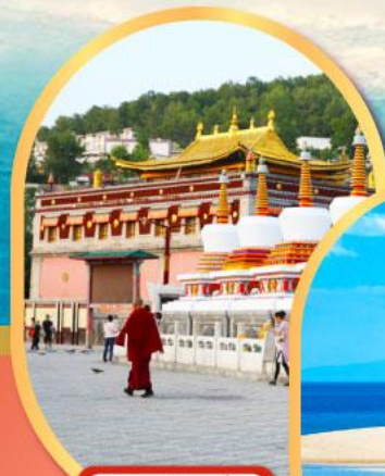
วัดท่าอ้อ