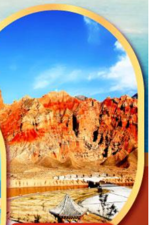
หุบเขาห้าสี อุทยานธรณีกุ้ยเต๋อ