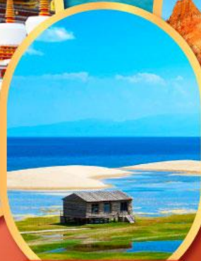
ทะเลสาบชิงไห่