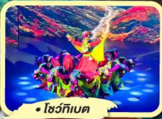
• โชว์ทึบค