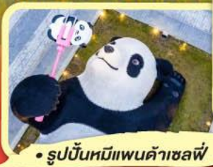
• รูปปั้นหมีแพนด้าเซลฟี