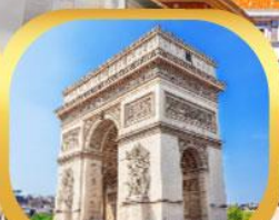
ประตูชัย