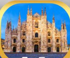
มหาวิหารมิลาน