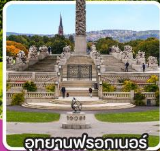
อุทยานฟรอกเนอร์