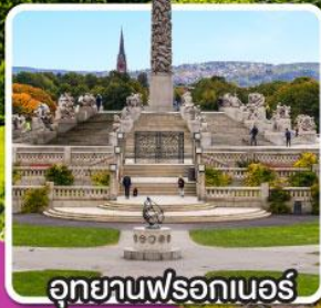
อุทยานฟรอกเนอร์