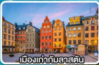
เมืองเก่าทิมลัสตัน