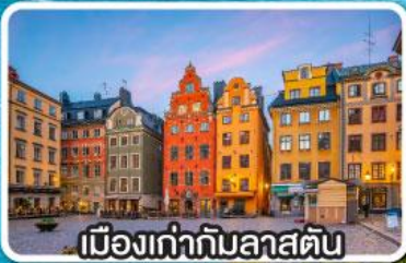
เมืองเก่าทิมลาสดัน